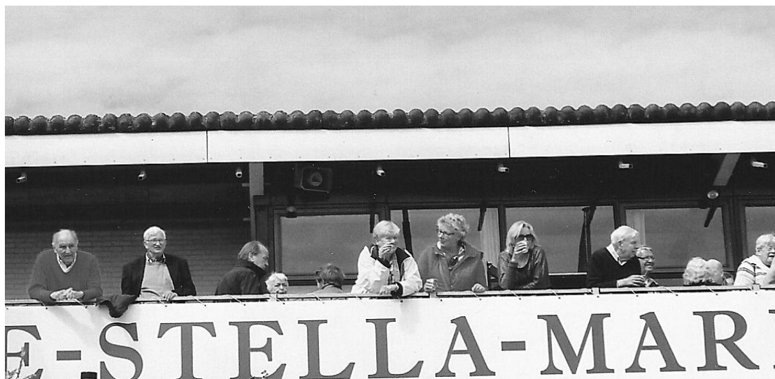
Tijdens de voorjaarslunch worden de hockeyprestaties bekeken en van commentaar voorzien door de diverse deskundigen !

Scheidsrechters: Jolles en Vogels (goed).